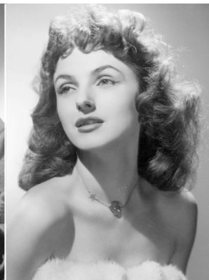
Dominique Michel, 1951