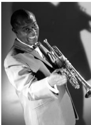
Louis Armstrong, 1967