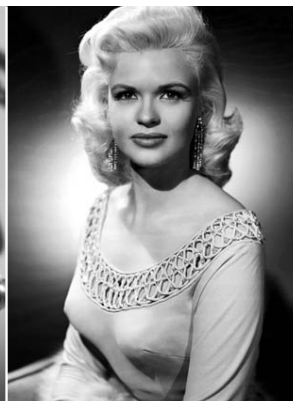
Jayne Mansfield, 1957