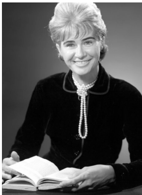
Anne Hébert, 1962