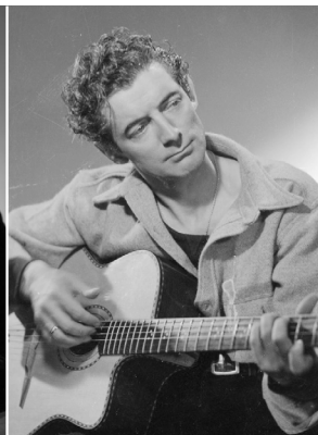
Félix Leclerc, 1951