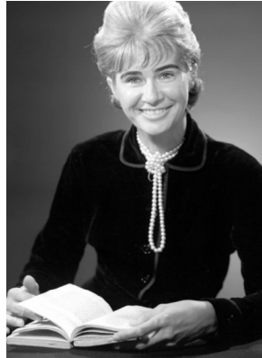
Anne Hébert, 1962