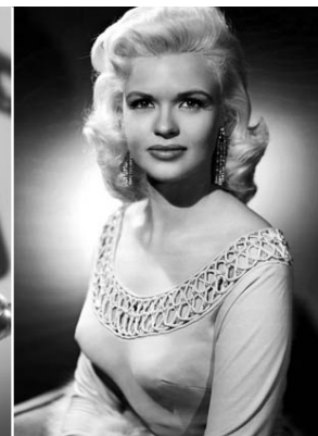
Jayne Mansfield, 1957