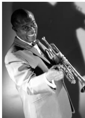
Louis Armstrong, 1967