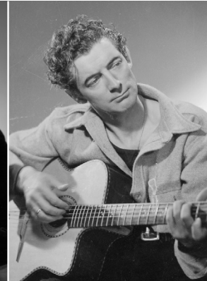
Félix Leclerc, 1951